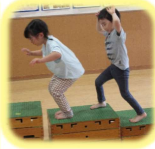
両足を揃えてジャンプ！！