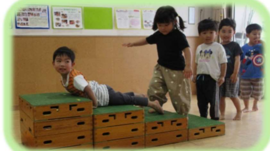
ワニに変身して巧技台を登ったよ！