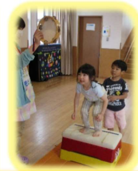
タンバリンを叩いでジャンプ！