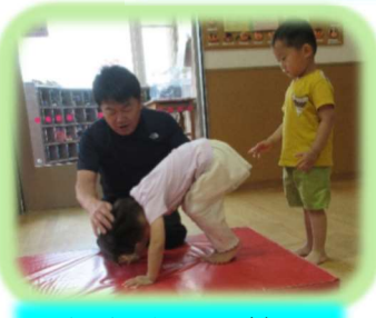
でんぐり返しの練習